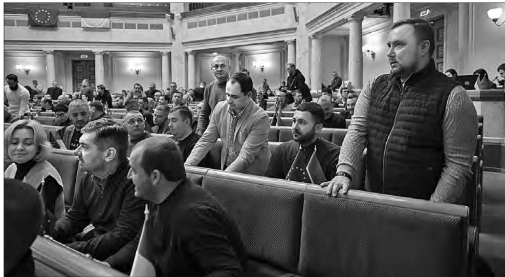
Під час засідання.

«Реалізація Закону в разі його прийняття потребуватиме поступового збільшення видатків з Державного бюджету України, передбачених для Національного антикорупційного бюро України, починаючи з 2024 року до 2026 року включно», — зауважується в пояснювальній записці. Утім, ініціатори змін очікують, що реалізація положень законопроекту посилить кадровий потенціал Національного антикорупційного бюро України. А це, зі свого боку, підвищить ефективність та результативність у розкритті та запобіганні корупційних злочинів. Цей проект змін парламентарії взяли за основу 323 голосами.