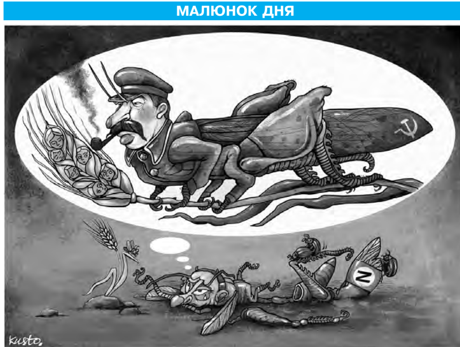
Еволюція геноцидомодифікованої кремлівської сарани від «серпа і молота» до «Z».

Своєю чергою фахівці Інституту вивчення війни (ISW) повідомля-